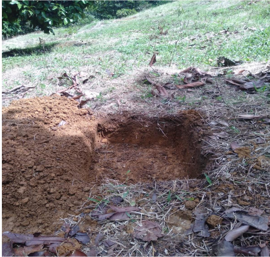
Lubang Tanam ( 25 cm Pertama )