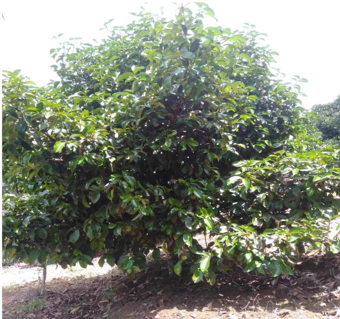
Tanaman berumur 10 Tahun