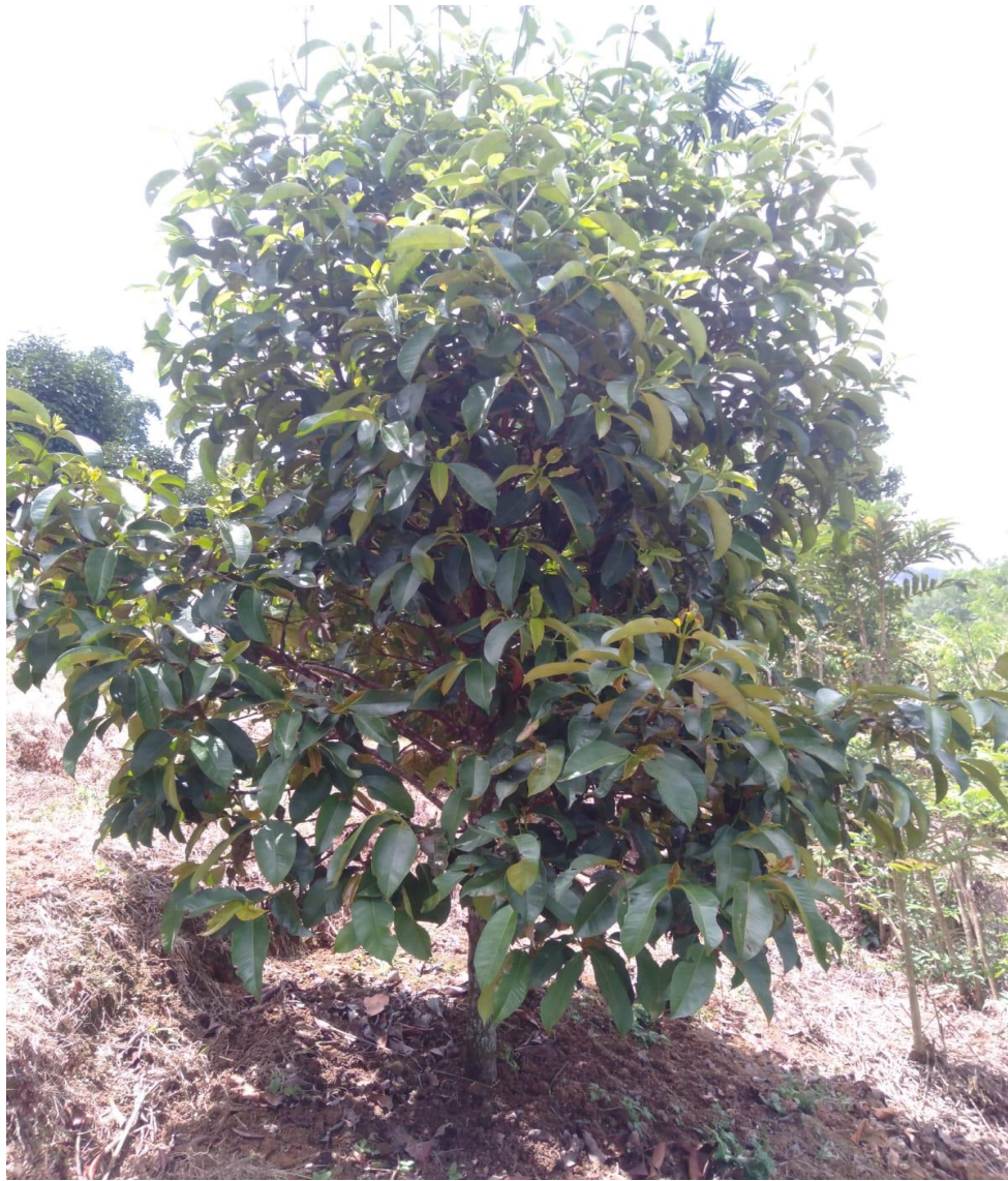
Tanaman berumur 5 Tahun