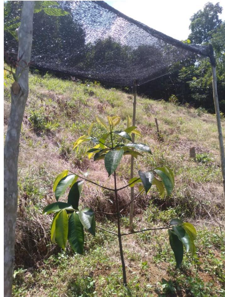
Tanaman Yang Sudah diberi Naungan