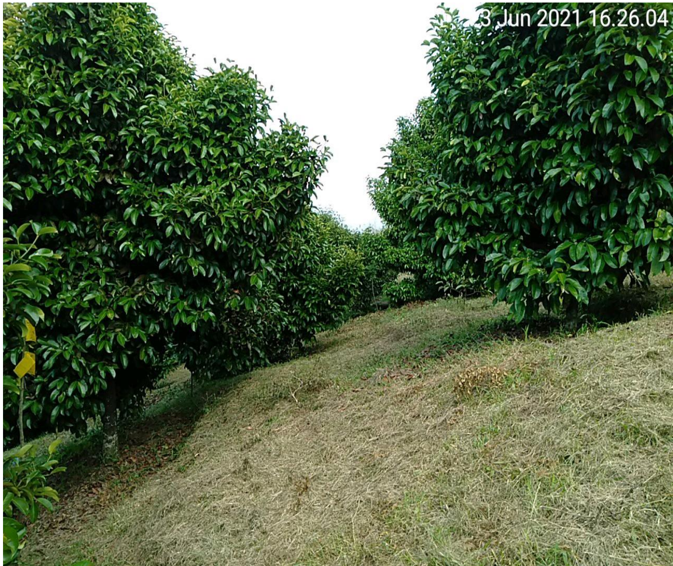
Tanaman berumur 20 Tahun