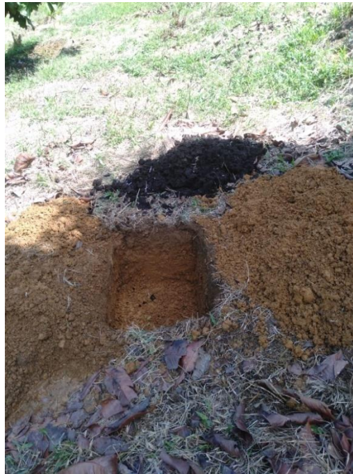
Lubang Tanam ( 25 cm Kedua )