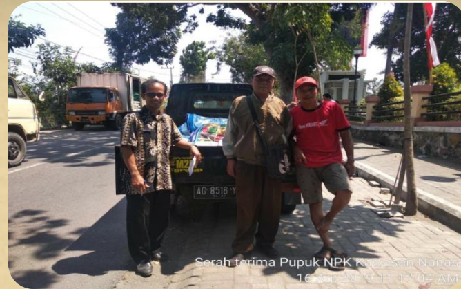
Serah terima Pupuk NPK ke Poktan Nana 16 Okt 2019 09:13:04 AM