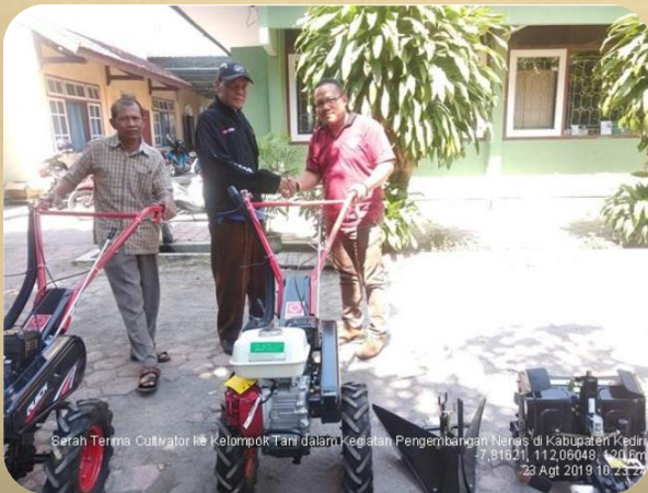
Serah Terima Cultivator ke Kelompok Tani dalam Kegiatan Pengembangan Nenas di Kabupaten Kediri 7,81621, 112,06048, 120120 23 Agt 2019 10:23:22