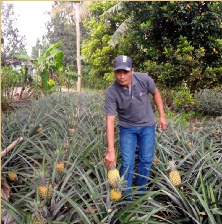
PANEN PASAR TRADISIONAL