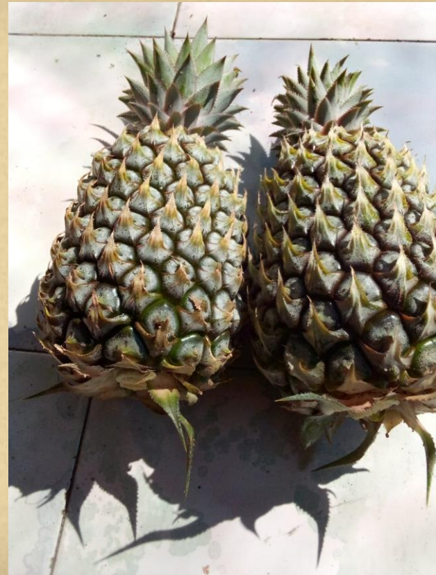
WARNA HIJAU TUA