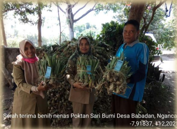
Serah terima benih nenas Poktan Sari Bumi Desa Babadan, Ngancar -7,91837, 412,2025 7 Okt 2019 10:21:58 AM