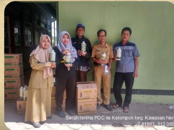
Serah terima FOC ke Kelompok keg. Kawasan Nena -7,81563, 112,0604